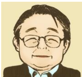
花輪敏男先生ってこんな感じ FR教育臨床研究所HPより

今回お招きした「花輪敏男先生」は、元国立特殊教育総合研究所情緒障害教育研究室室長、元特別支援学校校長で特別支援についての高い見識をお持ちです。また、10年前から継続して2泊3日の宿泊研修「不登校対応チャートワークショップ」を開催されています。実践に基づいた幅広い知識とそれを楽しく伝えるユーモアをお持ちの先生です。